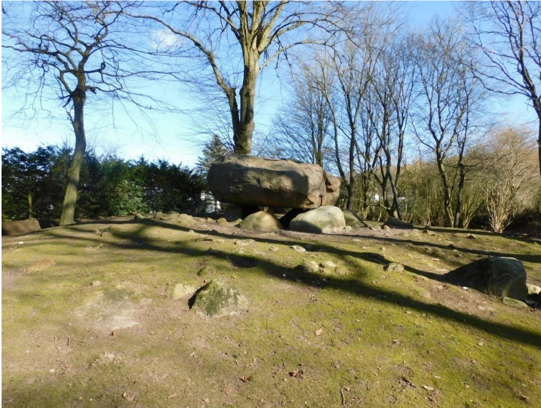
Abb. 1: Der Brutkampstein in Albersdorf

„So wollte einst der Bergedorfer Riese die Kirche in Schwarzenbek vernichten. Er warf einen Stein nach dem andern hin, traf aber immer zu kurz, und die Steine fielen im Saupark bei Friedrichsruh zur Erde. Einige sagen aber, hier hätten die Riesen ihren König begraben, und die Steine wären die Reste von seinem Denkmal.“ 4