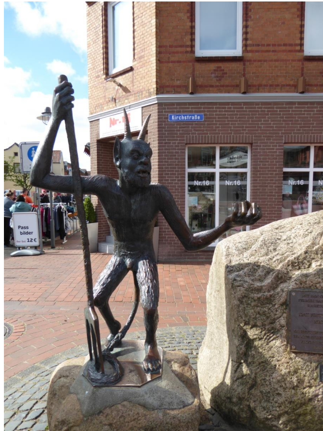
Abb. 3: Der Teufel von Gettorf

In Anbetracht des Umstandes, dass speziell Schleswig-Holstein über keinen Untergrund aus Hartgestein verfügt, kommt den Findlingen als Baumaterial eine besondere Bedeutung zu. Die Riesen sind bereits im alten heidnischen Glauben Teil der Welt und treten als ambivalente Wesen in den alten nordischen Mythen auf. Diese Ambivalenz, manchmal den Menschen freundlich gesinnt, oft aber auch feindlich, tritt auch in den volkstümlichen Sagen immer wieder zutage. Der Riese ist grob und nicht sonderlich raffiniert.