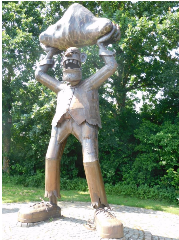
Abb. 2: Der Riese von Ulsnis